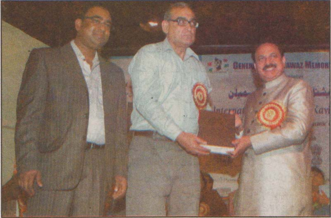
نئی دہلی، فیض فہمی کا اجراء کرتے ہوئے جسٹس مارکنڈے کاٹجو، ساتھ میں ڈاکٹر سید طارق عابدی و آصف اعظمی